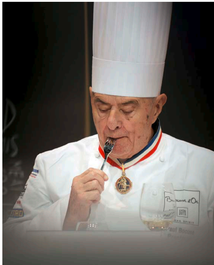
Bereits zu Lebzeiten war Paul Bocuse (1926 bis 2018) eine Legende.