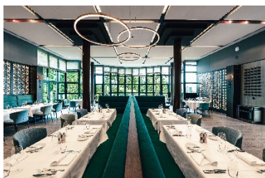
Legende zu Bild 4: ... und heute