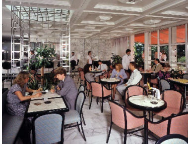
Legende zu Bild 5: SHL Club früher...