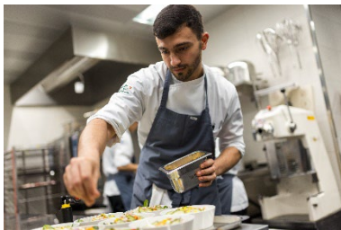
Legende zu Bild 7: SHL heute: Student des Semesters 1 beim praktischen Einsatz in der SHL Küche