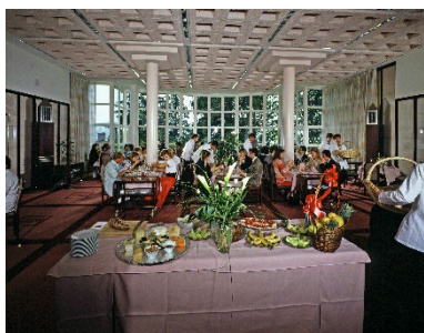
Legende zu Bild 3: SHL Ausbildungsrestaurant früher...