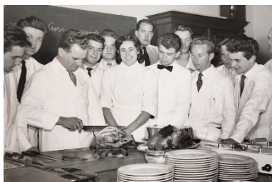
Legende zu Bild 2: SHL anno dazumal (Archivbild)