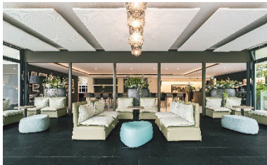
Legende zu Bild 6: ... und heute